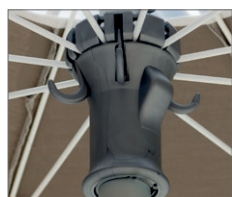
Sistema di chiusura mod. Diamante. Umbrella closing system mod. Diamante.