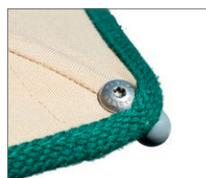
Fissaggio del tessuto tramite sistema a vite. Fabric fixed using a screw system.