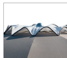
Soffietto antivento. Windproof Vent.