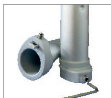
Sistema mod. Scirocco per fissaggio palo con brugola. System mod. Scirocco To fix pole with Allen key.