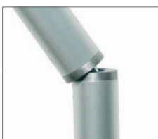
Snodo per ombrellone. Joint for beach umbrella.